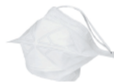
Фильтрующая полумаска 3M™ VFlex™ 9101, 9101S